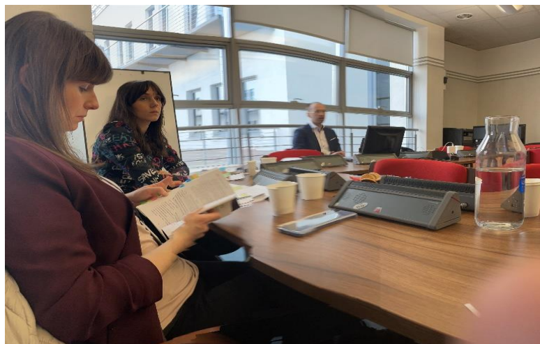
Przyg. Rafał Szarek