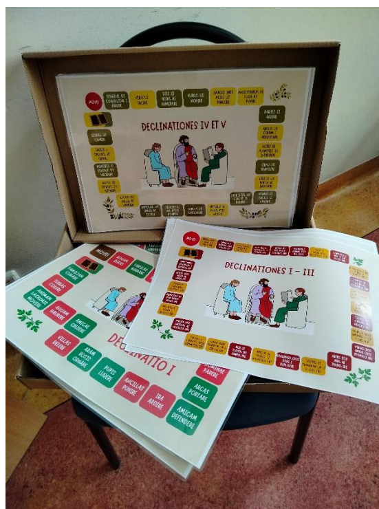
Przykładowy zestaw gier – deklinacje łacińskie.

W semestrze letnim 2024/2025 przygotowano program i pomoce dydaktyczne na semestr zimowy (1 semestr nauki łaciny) następnego roku akademickiego. W ramach spotkań zespołu projektu powstały pomoce do wyznaczonych zagadnień gramatycznych: deklinacje I-III rzeczowników i przymiotników; liczebniki główne i porządkowe; 4 koniugacje; 3 formy podstawowe czasownika; ind. praes., imperf. fut. I., perf. act.; imperat. praes. act., inf. praes. i perf. act.; czasownik sum, esse, fui i złożenia; przyimki; zaimki osobowe, dzierżawcze, pytajne; zaimek qui, quae, quod; participia: praes. act i perf. pass.; dat. possessivus, abl. temporis, causae, modi, instrumenti; abl. auctoris, abl. rei efficientis; acc. duplex; ACI; 4 formy podstawowe czasownika; ind. praes., imperf., fut. I., perf. pass.; imperat. praes. pass., inf. praes. i perf. pass; supinum; oraz pomoce literacko-kulturowe, do tekstów łacińskich Neposa i Tacyta. Do wszystkich zagadnień, podobnie jak w poprzednim semestrze, powstały różnorodne aktywności, tj. gry planszowe, karty do gry zespołowej, wykreślanki w różnorodnej formie, memory , domino, karty pracy, infografiki i karty pracy w formie gazetki (miesięcznik literacki).